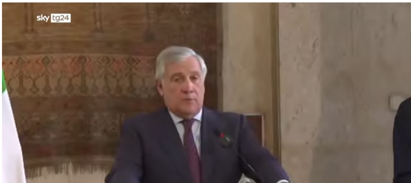
Il Ministro degli Esteri in Egitto sosterremo gli sforzi del Cairo per la