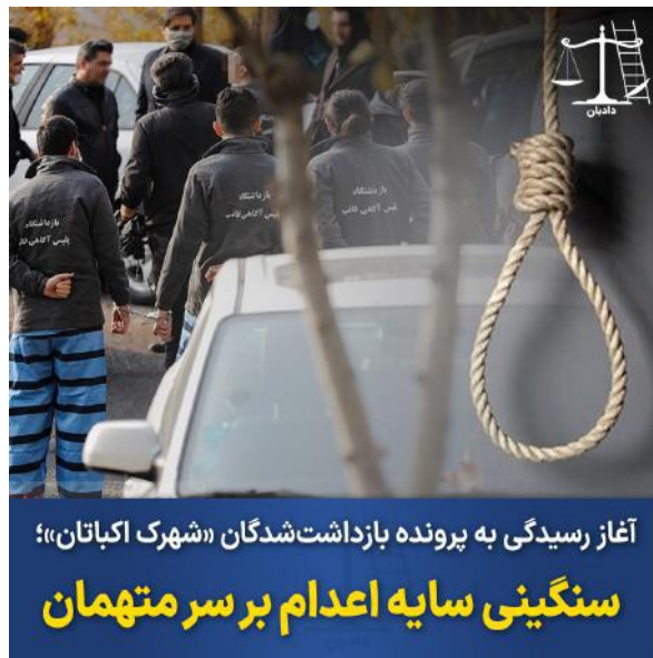
( https://dadban.info/wp-content/uploads/2023/10/2-1.jpg )

Finally, after almost a year has passed since the arrest of the defendants in the case known as Shahrak Ekbatan in Tehran, the first hearing of this case was held on 15 Mehr in branch 13 of the criminal court of Tehran province.