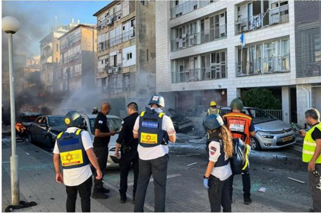
A house in central Israel was damaged by a rocket fired by Hamas from the Gaza Strip. October 7, 2023